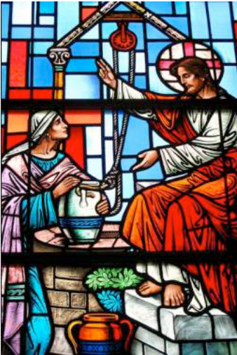
Feuilles de cannabis, St Virgil's church

Tu es un jardin fermé, ma sœur, ma fiancée, Une source fermée, une fontaine scellée. Tes pousses forment un jardin, où sont des grenadiers, Avec les fruits les plus excellents, les troènes avec le nard et le safran le kaneh et le cinnamome, Avec tous les arbres qui donnent l'encens, la myrrhe et l'aloès, avec tous les principaux aromates Le Cantique des Cantiques