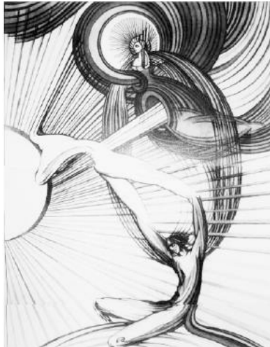
Fay Pomerance, « L'union d'Isis à Osiris », figure monochrome, 1959