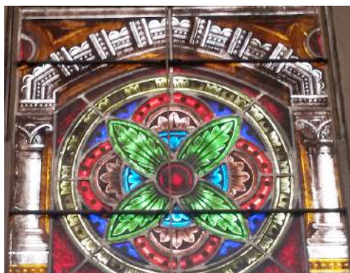
Holy cross cathedral, Boston

Jusqu'à des temps proches de nous, le cannabis était utilisé dans certains baumes de consécration et nous pouvons le retrouver représenté relié au lys et à la rose sur des vitraux d'église dédiés à la Vierge Mère.