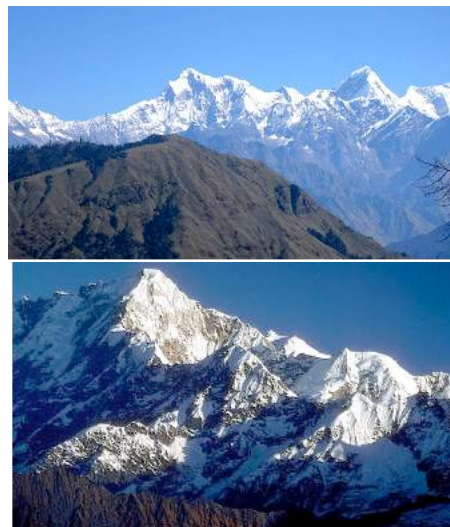
Montagnes tibétaines sacrées : Ganesh Himal mountains.