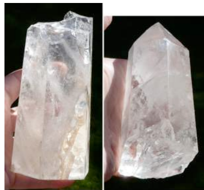
Cristaux cassés de quartz tibétain d'altitude. Ils sont utilisés pour la fabrication du quartz bleu.

Le Quartz Bleu 'tibétain' Sibérien d'altitude est un effort commun, une synergie entre l'homme et la nature. Cette pierre de quartz rare et spéciale est impeccable et n'a aucune impureté. Le quartz Bleu 'tibétain' Sibérien d'altitude a été cultivé et créé dans un laboratoire en Russie. Il est créé par un processus dans lequel le haut quartz tibétain naturel d'altitude que nous leur avons donné est décomposé et re-cultivé avec le cobalt qui lui donne sa couleur bleu foncé. Le cristal de quartz tibétain d'altitude utilisé pour la fabrication du quartz bleu 'tibétain' Sibérien d'altitude a été honoré avant qu'il n'ait été extrait.