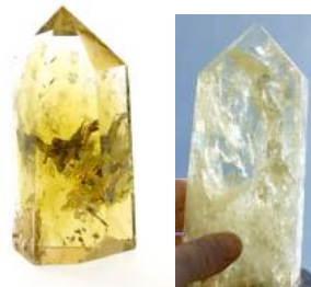
Citrines du Ganesh Himal

Rayon OR... Une véritable citrine dorée, non chauffée, un Soleil... La citrine est une pierre solaire qui dégage une énergie positive et tonifiante. Excellente pour les gens fatigués et déprimés. Stimule également l'imagination et les facultés mentales, apportant un meilleur discernement. Favorise la manifestation dans le réel des idées et de la volonté divine au travers nous. Apporte de l'optimisme, aide à résoudre les problèmes émotionnels où à les assimiler pour en tirer des conclusions positives, elle renforce la lumière intérieure. Elle est efficace pour les dépressions, la nervosité et l'inquiétude.