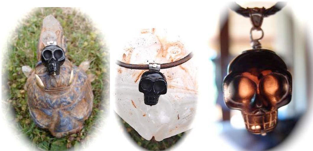
Les parties les plus minces laissent voir la transparence du quartz