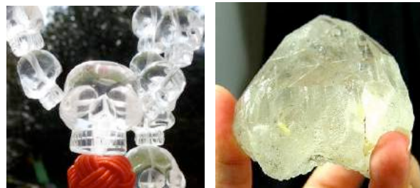
Perle "guru" du mala, Quartz platine du Ganesh Himal

Rayon platine... Synergie de tous les Rayons, il nous ramène à notre Transparence. La lumière se dégageant du cristal est incomparable... la différence énergétique entre un crâne de cristal de quartz provenant, par exemple, des mines de chine et récoltés à l'explosif... et un quartz tibétain de haute altitude se voit et se sent. Certains sont plus gros que ceux photographiés ici.