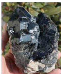
Quartz noir du Ganesh Himal

augmenter notre quotient de Conscience afin de nous libérer des liens affectifs aliénants et de communier avec les plans supérieurs. Le quartz tibétain noir est censé aider à la guérison du système nerveux, la réparation de la gaine de myéline, le cerveau et les ganglions nerveux. C'est le Shambhala Cristal Skull oeuvrant le plus profondément dans les refus et habitudes de la Matière.