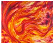
Feu et énergie du Jaspe Rouge...

Le Magic LingÂme en jaspe rouge est un activateur énergétique puissant. Le jaspe rouge joue un rôle protecteur et le « travail » avec l'œuf ou le Magic LingÂme rouge peut aligner et augmenter l'énergie vitale du corps, et celle de tous les chakras, et équilibrer les énergies yin yang.